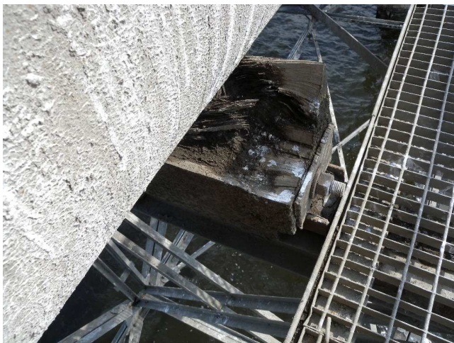
Fot. nr 2 – podparcia rurociągu

Wszystkie drewniane, klinowe elementy bezpośredniego podparcia rurociągu (2x42=84szt.) uległy biologicznej degradacji (zgnilizna miękka), należy je wymienić oraz wykonać zamocowanie podkładek gumowych (używana taśma przenośnikowa) na skośnych powierzchniach klinów. Rysunek konstrukcyjny podpór rurociągu na estakadzie stanowi załącznik nr 2 do opisu przedmiotu zamówienia.