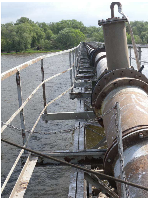
Fot. nr 4 – Strona północna estakady rurociągu

Brak pokładu uniemożliwia bezpieczną pracę podczas regulacji ułożenia rurociągu na bezpośrednich podporach klinowych, należy wykonać pokład z kratki pomostowych (0,6x172,0m).