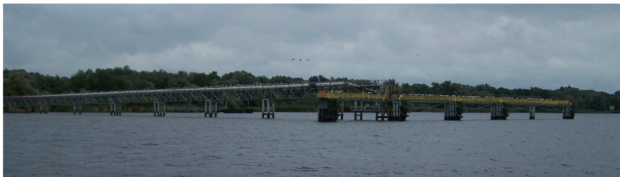
Fot. nr 1- Przystań refulera – widok od strony wody

Przystań pola refulacyjnego „Mańków” usytuowana jest na wschodnim brzegu Zalewu Szczecińskiego zwanej dalej Roztoką Odrzańską w bezpośrednim sąsiedztwie 44,0 km toru wodnego Świnoujście – Szczecin. Rysunek sytuacyjny stanowi Załącznik nr 1 do opisu przedmiotu zamówienia.