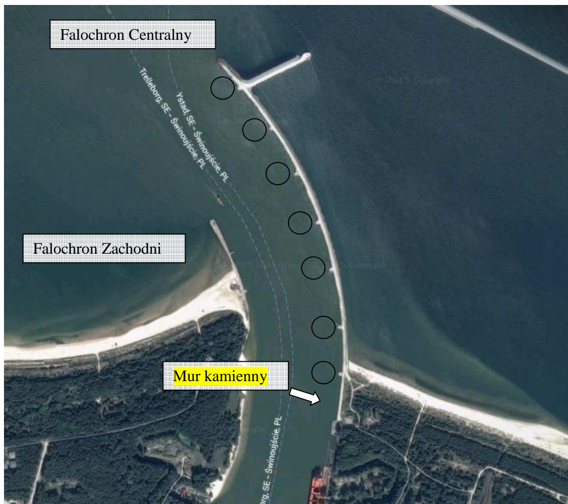
Widok falochronów portu Świnoujście

Usytuowanie obiektu pokazano na poniższej fotografii.