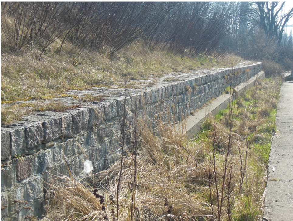
Mur (parapet) kamienny. Widok ogólny foto 1

Mur ma długość ok. 199,0m, w planie jest zakrzywiony w łuk. W zależności od lokalizacji, mur od strony odlądowej jest częściowo przysypany gruntem do lica górnej krawędzi muru.