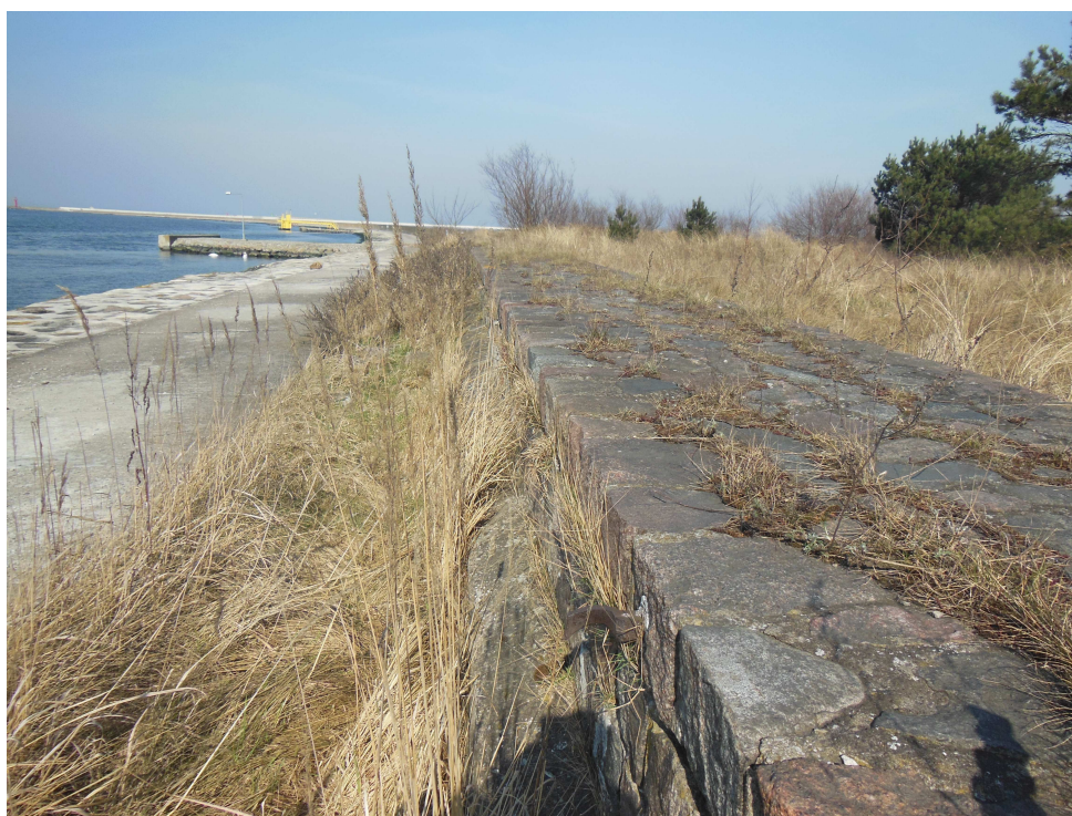
Mur (parapet) kamienny. Widok ogólny. foto 2