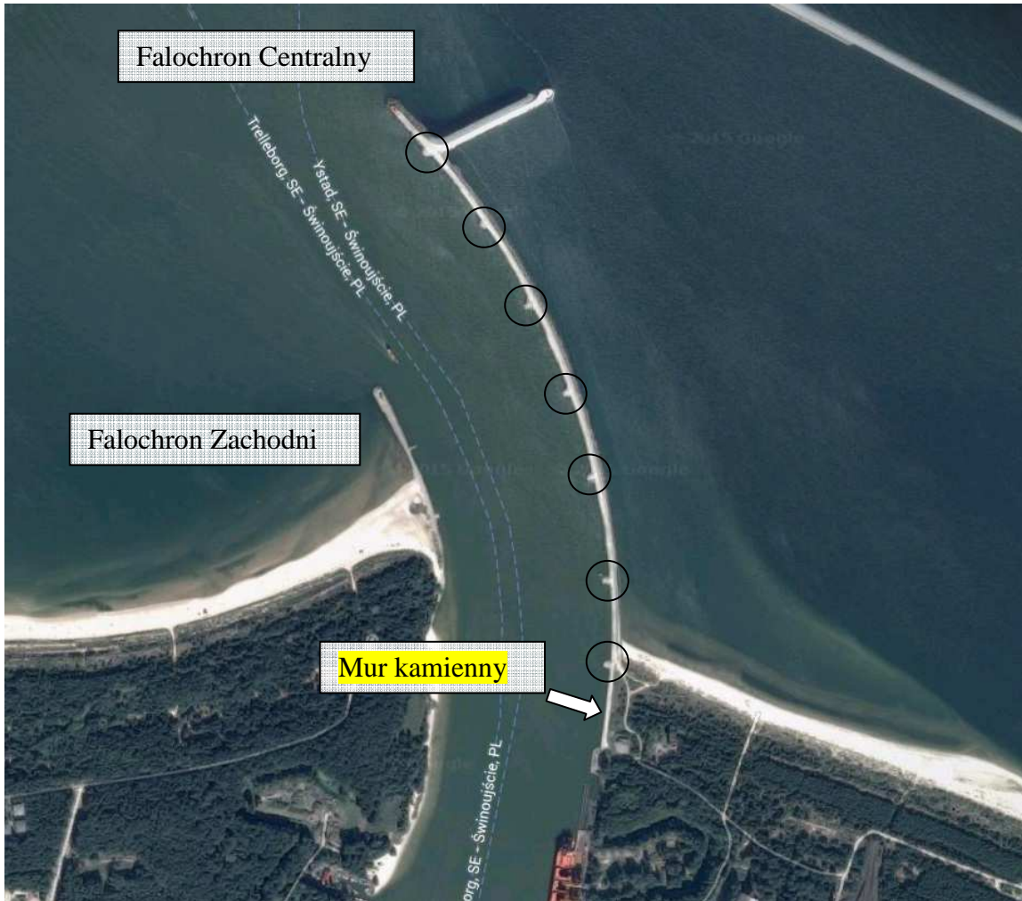
Widok falochronów portu Swinoujście