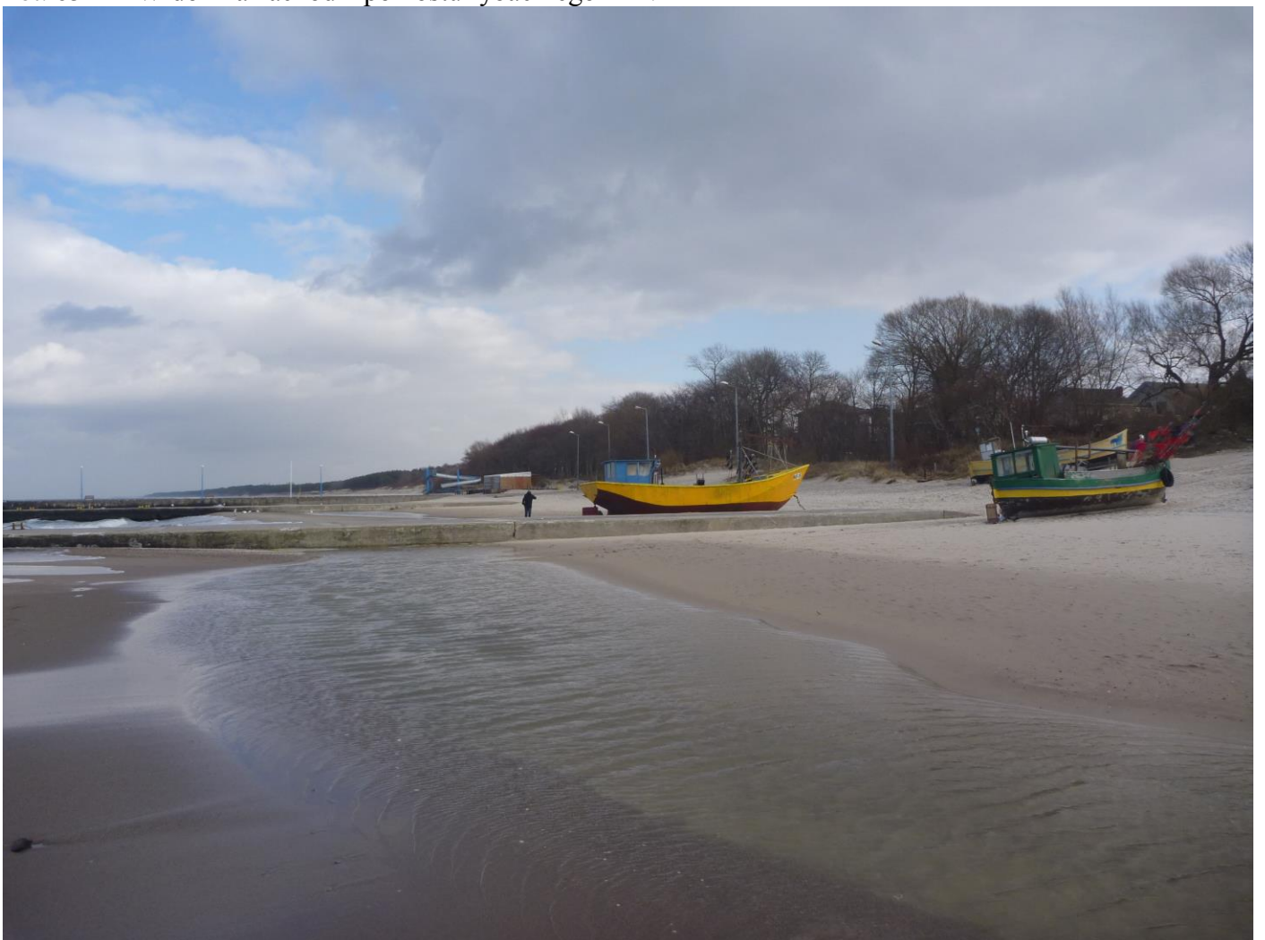
Fot. 06 Widok na wschód z pomostu rybackiego nr 1.