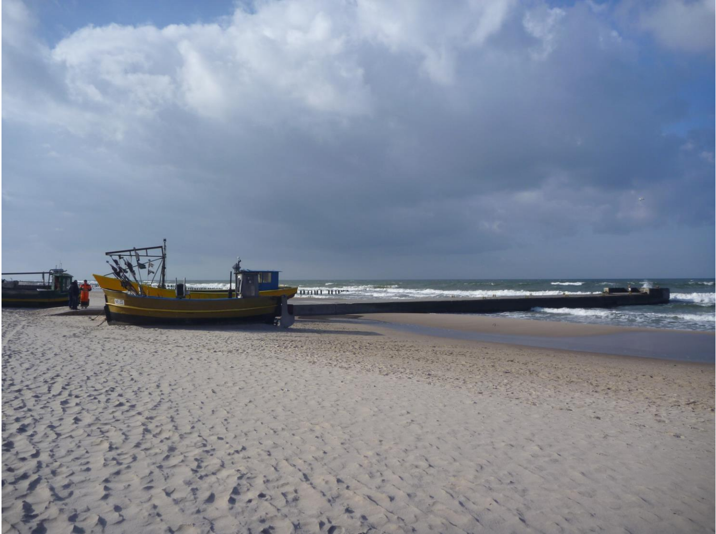
Fot. 03 Widok ogólny pomostu rybackiego nr 1 przewidzianego do rozbudowy – od strony wschodniej.