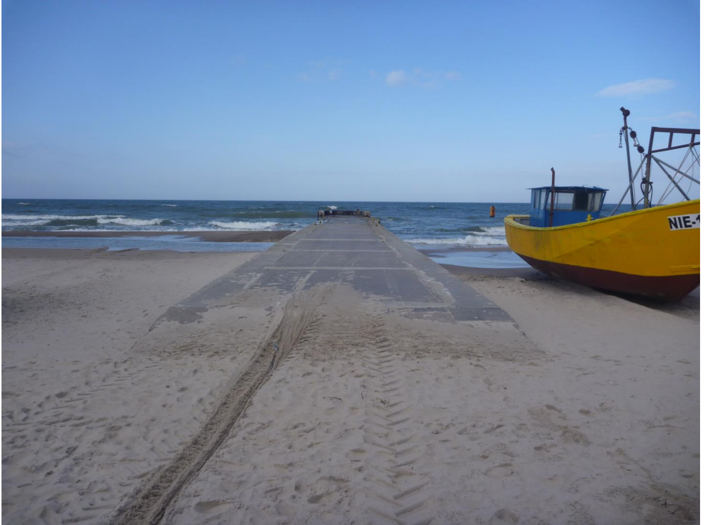
Fot. 07 Widok ogólny pomostu rybackiego nr 1 przewidzianego do rozbudowy.