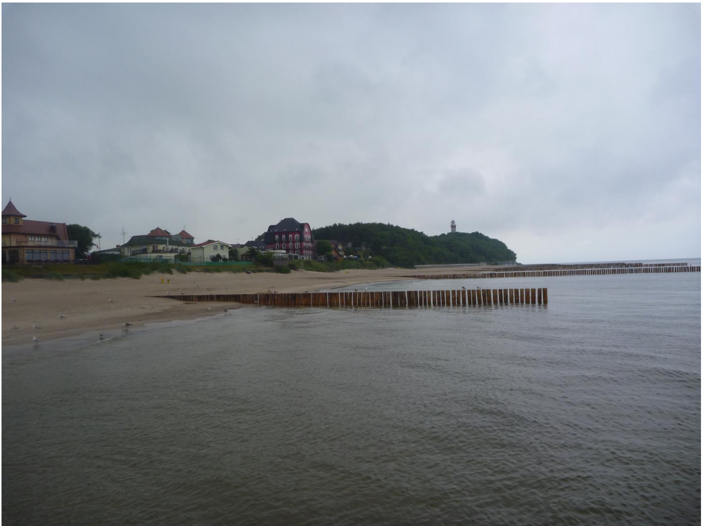
Fot. 05 Widok na zachód z pomostu rybackiego nr 1.