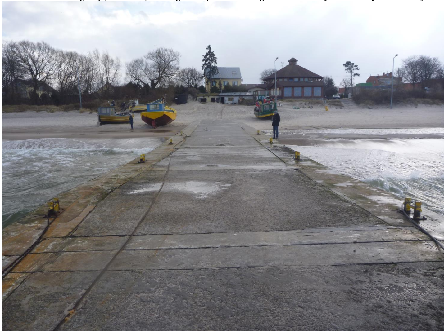
Fot. 04 Widok z pomostu rybackiego nr 1 w stronę lądu.